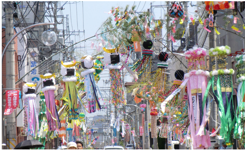
原町本通り商店街の人々は地震に負けず、七夕まつりを決行しました

2010年末から計画を立て、原町本通りに所在する伝統建築の調査を始めた矢先、2011年3月に東日本大震災発生。これは困った、研究活動は続けられない。そこで浮かんだ秘策をもとに何とかやり遂げることができました。